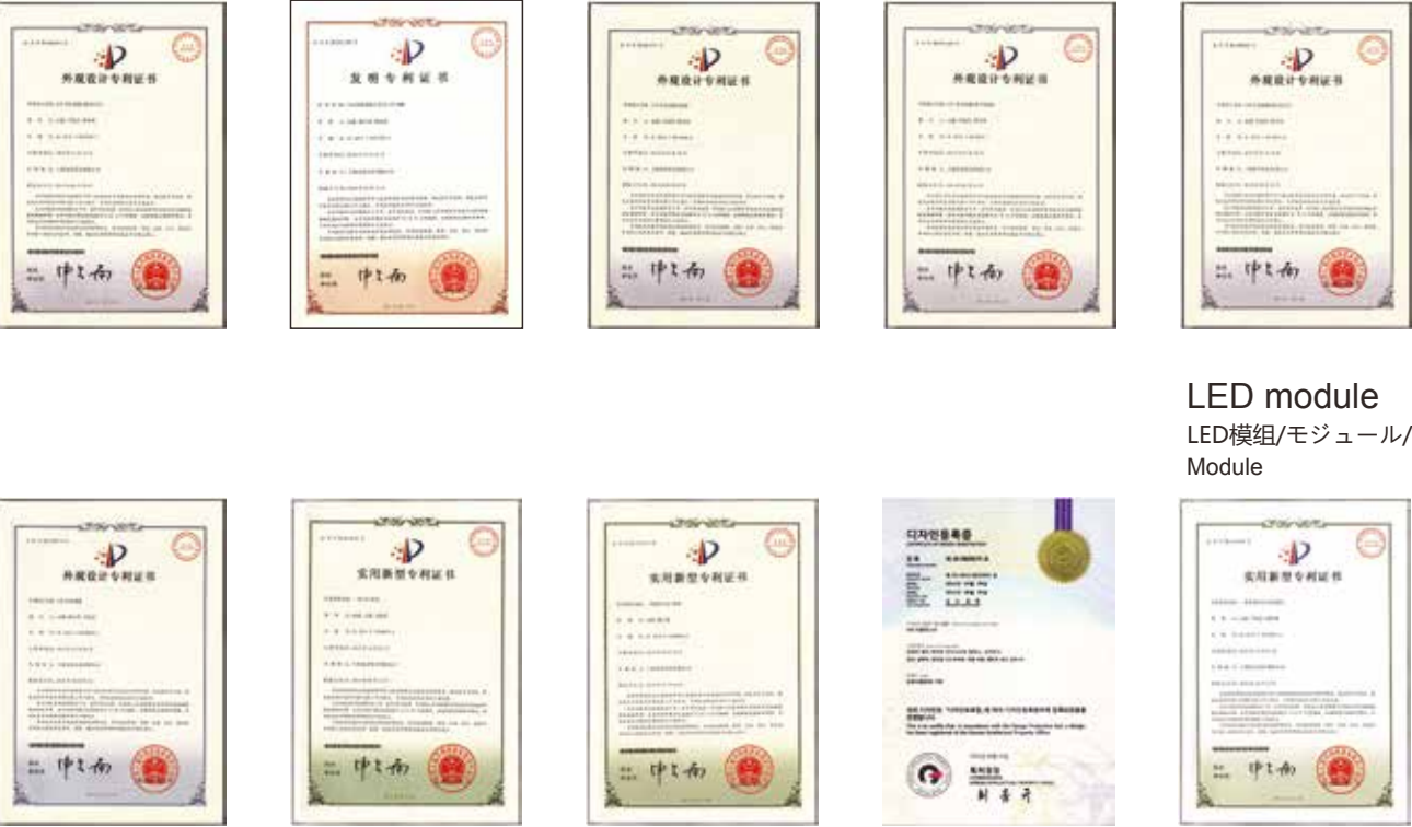
LED module LED模组/モジュール/ Module